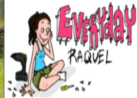
Artiste - Illustratrice à Dunkerque.